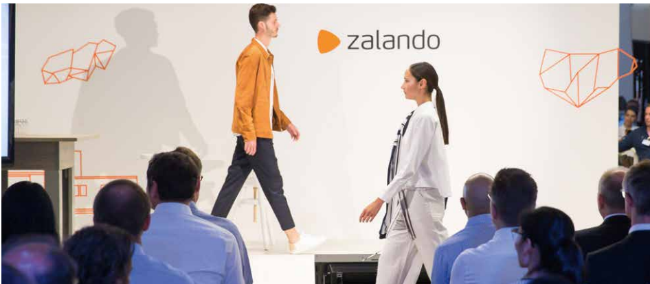
Catwalk-Präsentation der Zalando-Kollektion beim Kapitalmarkttag 2017.